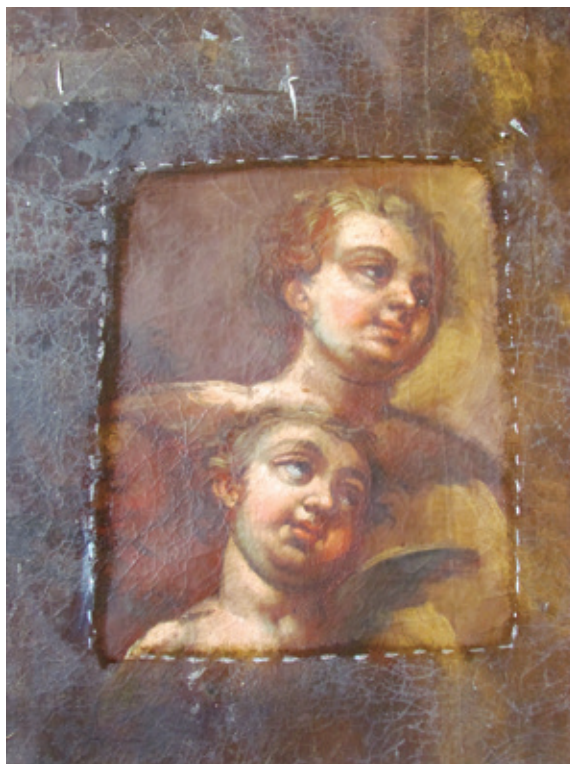
Сл. 4. Пробно чишћење на слици М. Ханиша Св. Пејтар и Павле (1806)