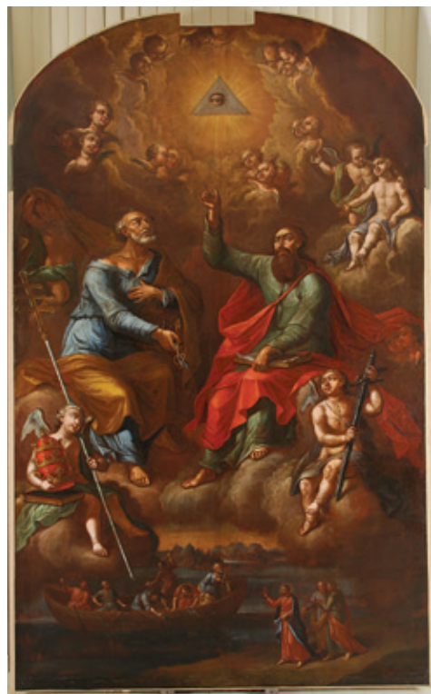
Сл. 5. Рестаурирана слика великог формата М. Ханиша Св. Пејтар и Павле (1806, 390 × 240 cm)