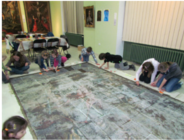
Сл. 3. Одстрањивање фејсинга са слике Св. Пејтра и Павла из Бачког Моноштора на изложби у Суботици 2014. године