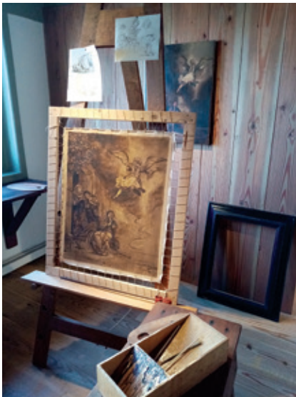
Сл. 8. Холандска припрема носиоца у реконструисаној барокној сликарској радионици „Rembrandthuis-Amsterdam”