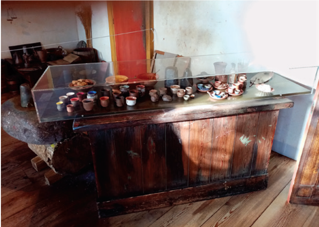
Сл. 7. Реконструисана барокна сликарска радионица „Rembrandthuis-Amsterdam”; поред стола је порфирни камен за припрему пигмента